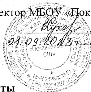
График работы по предоставлению населению плоскостных сооружений МБОУ «Поканаевская СШ»